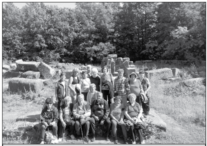
Светилището Мишкова нива

За първи път заставаме пред термите на античния град, където е изградено Светилището на трите нимфи. А след близо четиричасов преход откриваме манастир с името „Животоприемен източник“ в околностите на село Голямо Буково, с вградено в олтара аязмо. Сред прекрасни гори в свежата майската