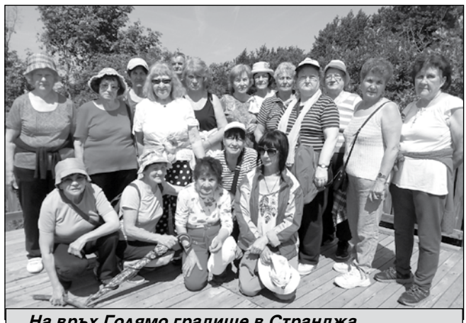
На връх Голямо градище в Странджа