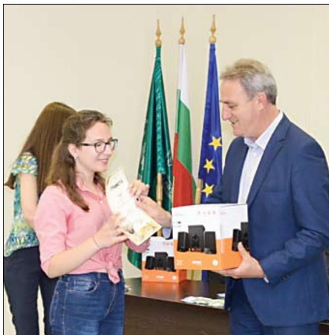
Участници, организатори и гости