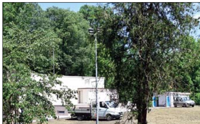
Седмица преди старта на празниците, обективът на НП видя довършителните работи около сцената