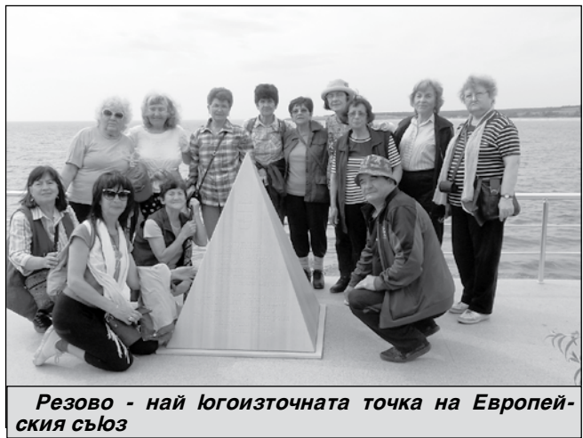
Резово - най югоизточната точка на Европейския съюз

И така, ние, 20 туристи-ветерани, се отправихме с автобус към портата на загадъчна Странджа, към Националния археологически резерват „Античен и средновековен град“ Делтум-Дебелт - село Дебелт. Той е единствената римска колония на западния бряг на Черно море, като част от мерките, предприети от императора Веспасиан за стабилизирание на новооснованата провинция Тракия. Три века градът се е разраствал и утвърждавал като един от най-богатите в провинция Тракия. Сякъл е над 150 собствени бронзови монети от края на I до