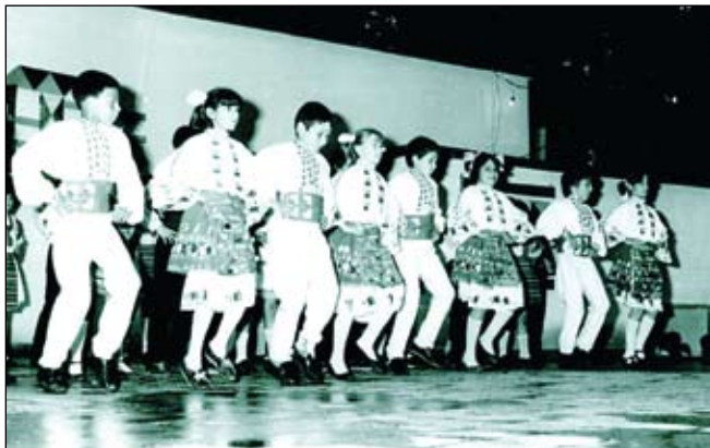
„Славееви нощи“ - 1985-та, само година преди да бъде обявен първият конкурс за деца - индивидуални изпълнители до 14 години

Освен наградния фонд за конкурсите, осигурен от Община Айтос и спомоществователи, на юбилейното издание ще бъдат връчени и специални награди -