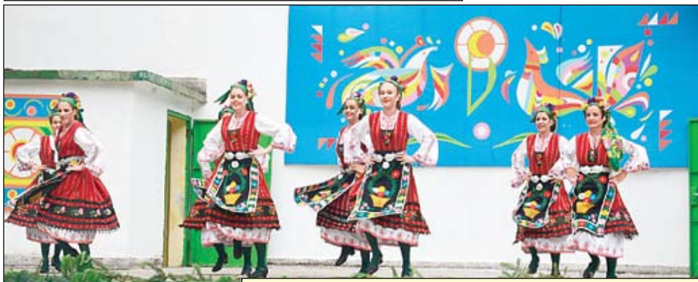
„Славееви нощи 2017“

В началото празниците не били само фолклорни, но Съветът за култура подбирал за участие в концертите предимно народни със-