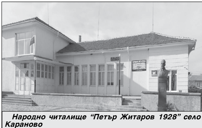
Народно читалище „Петър Житаров 1928“ село Караново