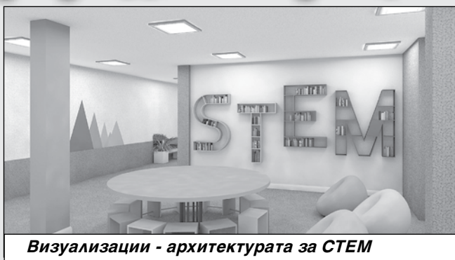
Визуализации - архитектурата за STEM