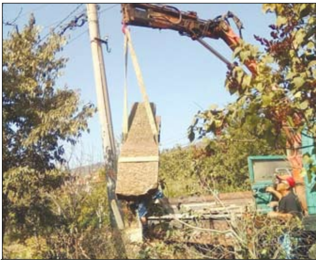
Само пет дни, в които трябва да се свърши всичко