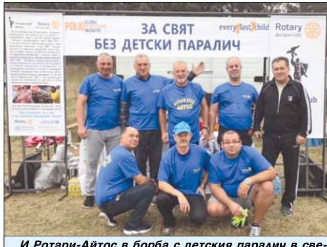
И Ротари-Айтос в борба с детския паралич в световен мащаб