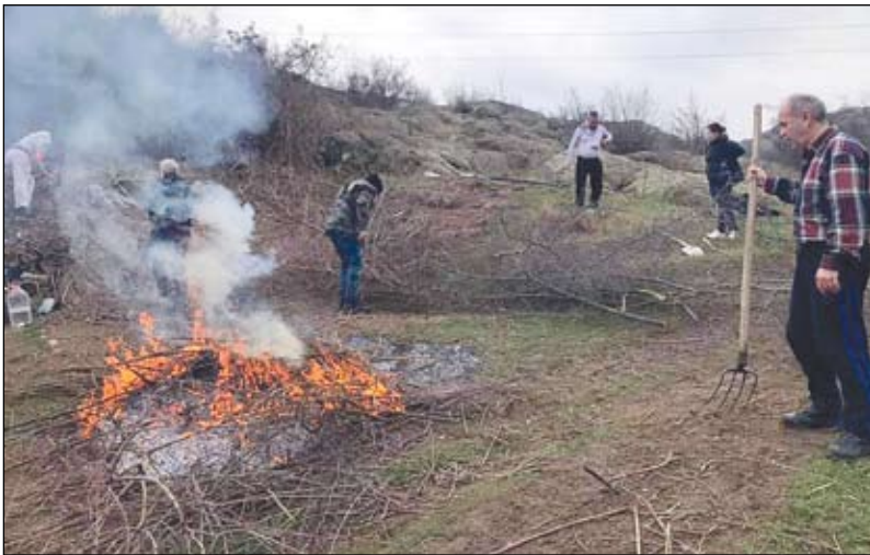
Акция на Ротари за разчистване на терена около извора