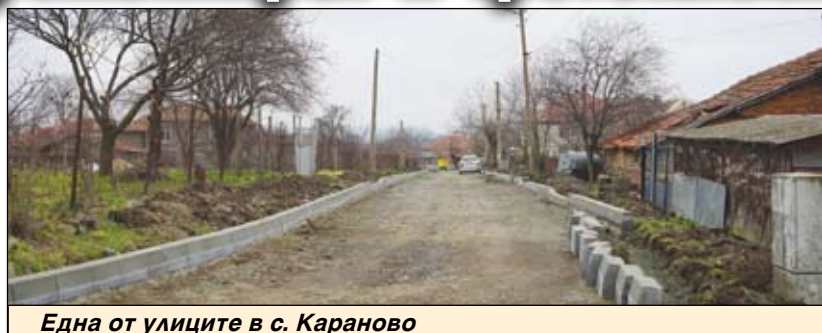
Една от улиците в с. Караново

"Напролет ще имаме перфектен път - от табелата на Айтос, чак до Трояново. Част от тези 24 км, които се ремонти-