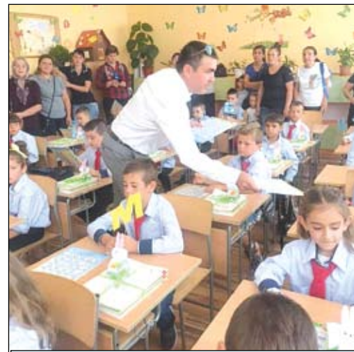
Учебни помагала за първолаците