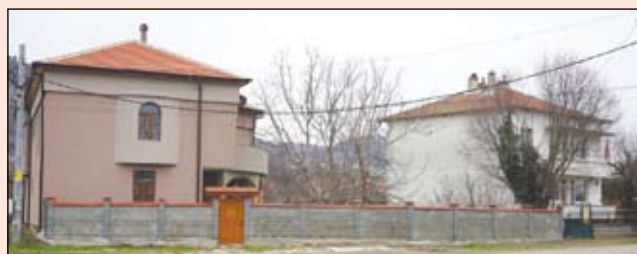
Много са новите къщи в Съдиево, издигнати през последните години