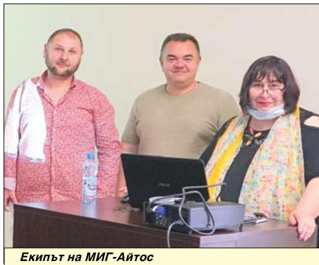
Екипът на МИГ-Айтос

рев подписа договор с Държавен фонд „Земеделие“ и МИГ-Айтос за отпускане на безвъзмездна финансова помощ за изпълнение на проект „Вътрешно преустройство на кафе-аперитив в административната сграда на общински комплекс „Алея на занаятите“, в посетителски център. Финансирането беше предоставено по процедура чрез подбор на проектни предложения, по мярка 7.5. „Инвестиции за публично ползване в инфраструктура за отиди, туристическа инфраструктура“ по Стратегията за Водено от общностите местно развитие на СНЦ „МИГ-Айтос“ от Про-