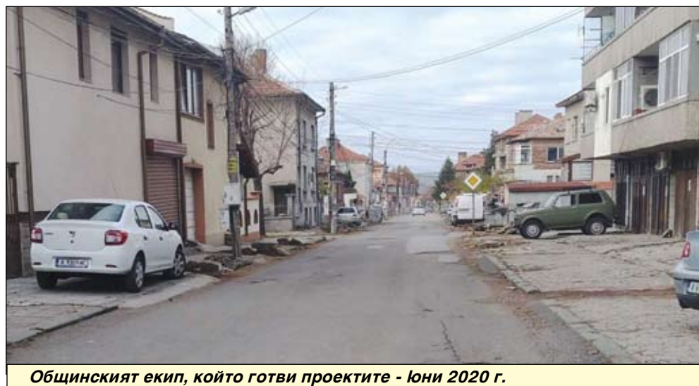
Общинският екип, който готви проектите - юни 2020 г.