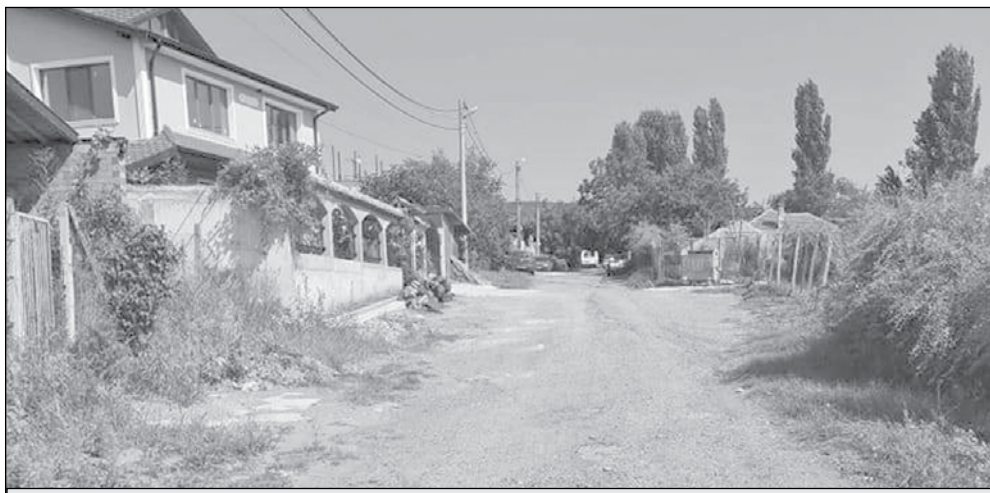
Реконструкцията на ул. „Арда“ е заложена в един от общинските проекти