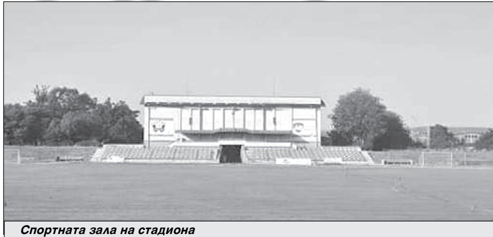
Спортната зала на стадиона

Проектът е за рехабилитация на уличните настилки, както и повърхностното отводняване, благоустрояване на тротоарни площи, изграждане на бетоннови бордюри и осигуряване на достъпна среда, включително