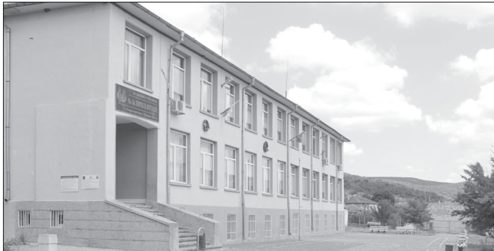
99% от родителите в Карагеоргиево казаха "да" на тестовете и присъственото обучение

81% са родителите от с. Мъглен, които са подали декларация за съгласие, съобщава директорът на ОУ "Хрис-