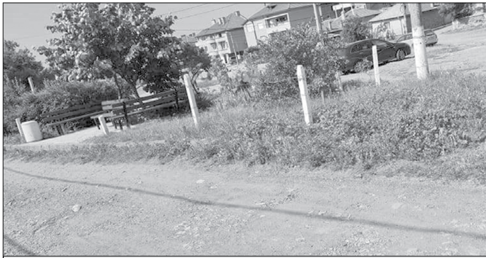
За ул. „Христо Кърджиков“ също са предвидени ремонти.