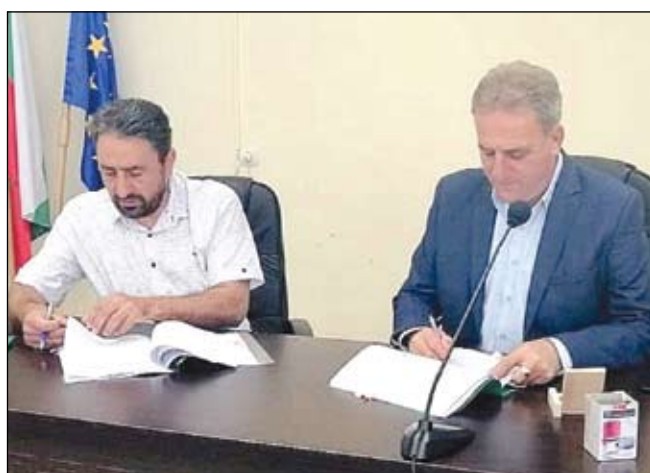
9 юни 2020 г. - подписването на първия административен договор за финансиране на общински проект

Целта на Стратегията е да стимулира местното развитие и да превърне територията на МИГ - Айтос в динамично развиващ се район, с разнообразен и устойчив бизнес, осигуряващ заетост, справедливи и стабилни доходи и ефективно използване на местните ресурси. Финансовият ресурс е за изпълнението на местни проекти в публичната сфера, бизнеса и НПО на територията