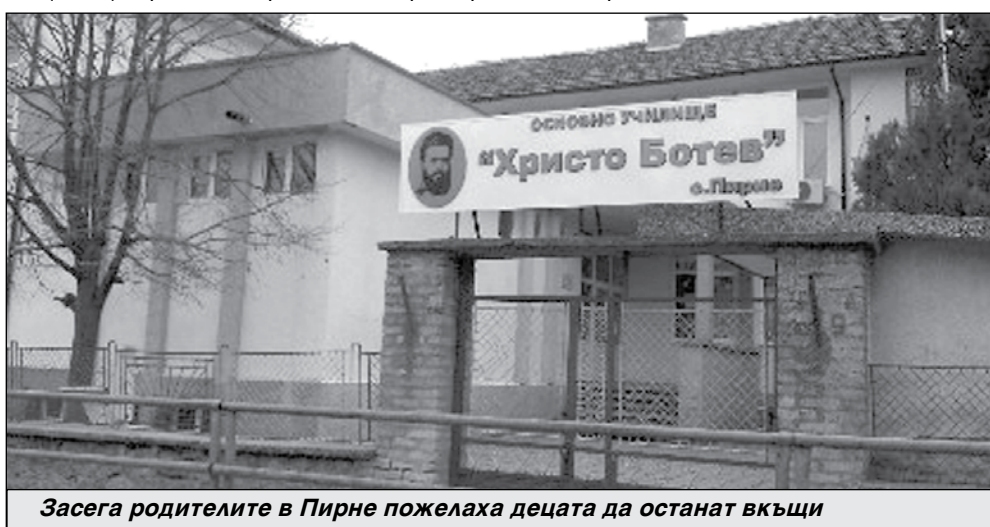
Засега родителите в Пирне пожелаха децата да останат вкъщи