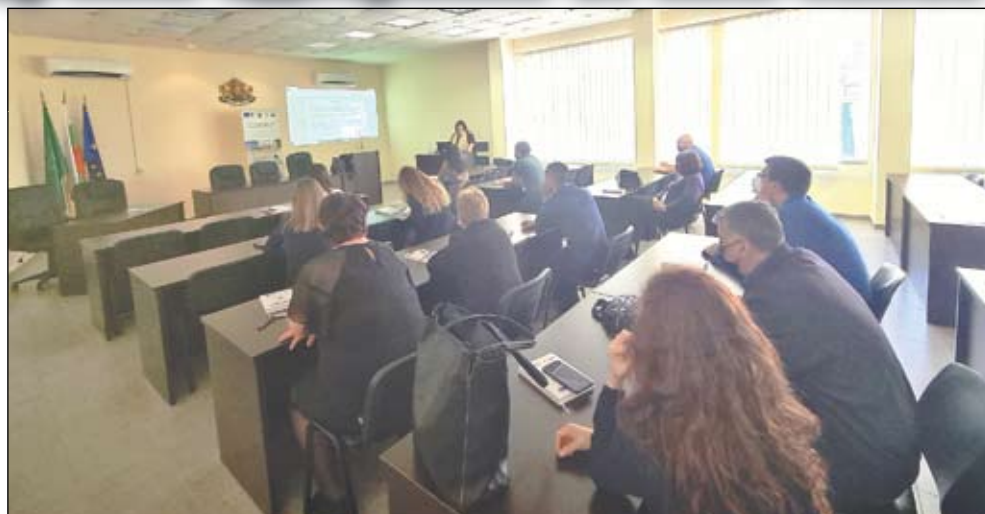
Информационните срещи за представяне на възможностите за кандидатстване с проекти по мерки от стратегията, семинарите, обученията и процедурите за подбор на проектни предложения са важна част от работата на МИГ-Айтос