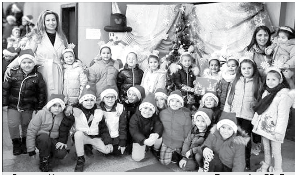
В топлия 10 декември децата от подготвителна група „Пчеличка“ от ДГ „Пролет“ - гр. Айтос заедно дойдоха в читалището, за да пуснат в пощата на Дядо Коледа коледното си писмо, в което подробно са описали мечтаните подаръци