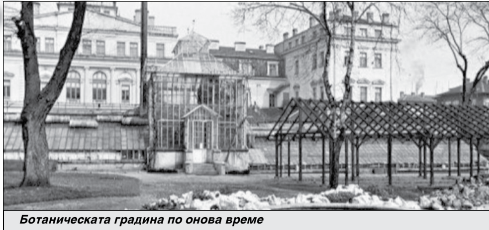
Ботаническата градина по онова време