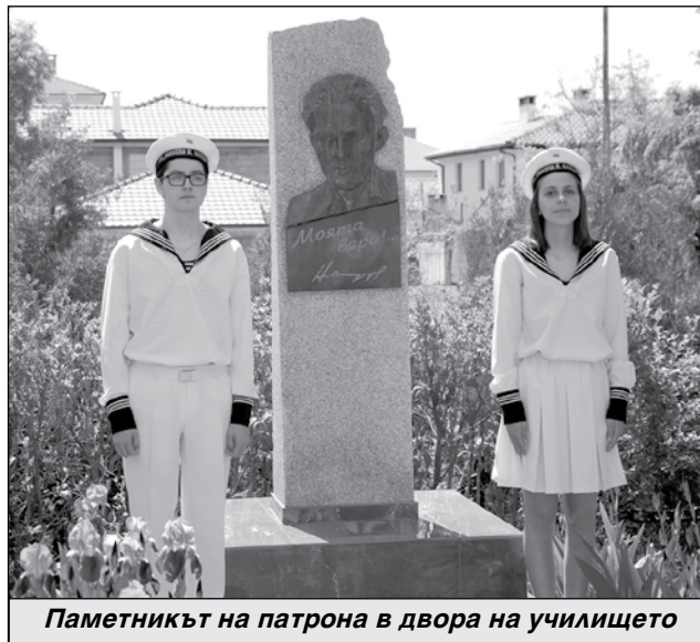
Паметникът на патрона в двора на училището