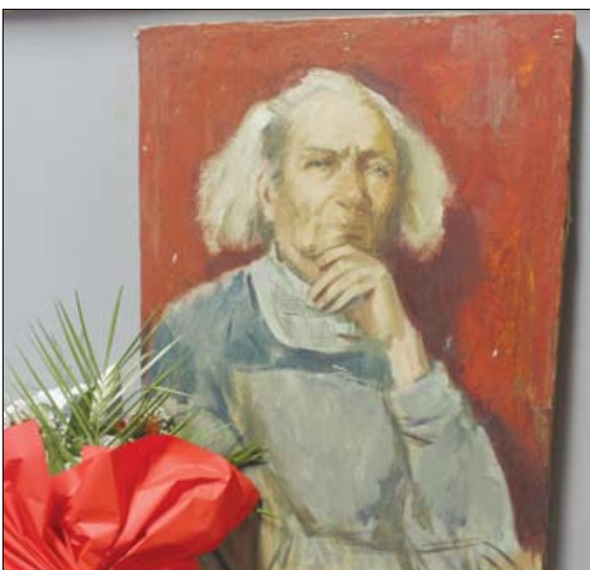
Портрет на Тодор Янчев от проф. Дончо Вълчев на изложбата за 105 години от рождението на художника през 2014 г.