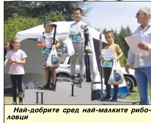
Най-добрите сред най-малките риболовци

Три атрактивни състезания организира през май на язовир "Парка" Ловно-рибарско дружество "Сокол" - Айтос. Първото беше двудневно и в него участваха отбори по двама души с две въдици. Надпреварата за майсторски улов на шаран на нежива стръв започна на 20 май, финалът беше по обяд на 22 май. Съдия претегляше шараните и ги връщаше обратно във водата.