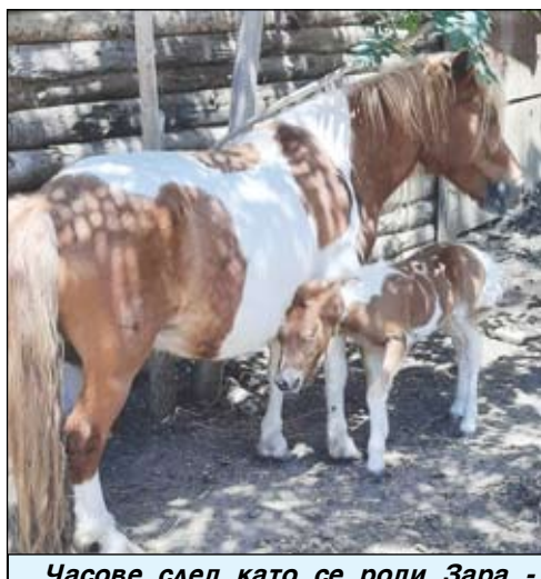
Часове след като се роди Зара - с мама на разходка