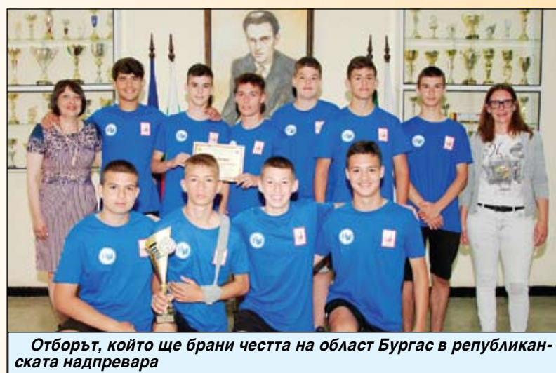
Отборът, който ще брани честта на област Бургас в републиканската надпревара

9 отбора на млади огнеборци на възраст от 12 до 16 години от Бургас, Карнобат, Айтос, Созопол и Камено.