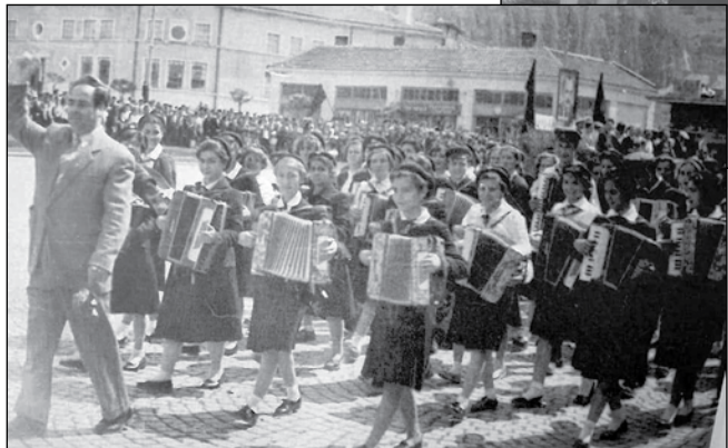
Акордеонният оркестър на училището - 24 май, 60-те години на ХХ век