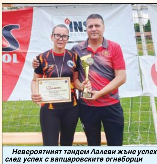
Невероятният тандем Лалеви жъне успех след успех с вапцаровските огнеборци