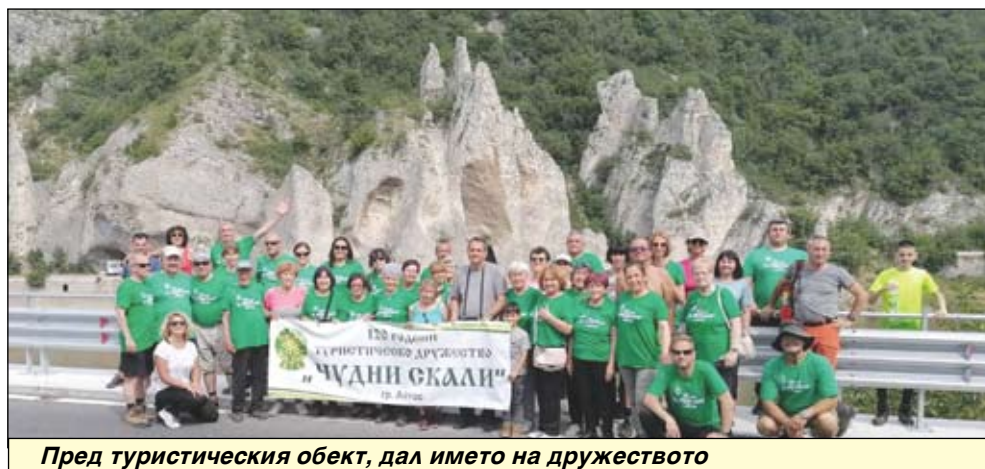
Пред туристическия обект, дал името на дружеството