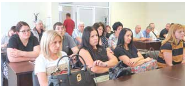
С конференция в Заседателната зала беше даден стартът на информационната кампания на МИГ-Айтос

Настоящата публикация е осъществена с финансовата помощ на Европейски земеделски фонд за развитие на селските райони във връзка със Споразумение за изпълнение на Стратегия за Водено от общностите местно развитие №РД50-146/21.10.2016 г. по подмярка 19.4. Текущи разходи и популяризиране на стратегия за развитие на селските райони за периода 2014 – 2020 г.