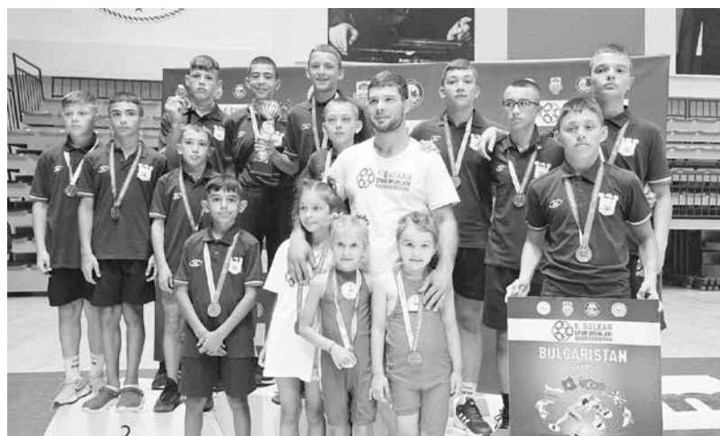
Отборът на СКБ „Айтос“