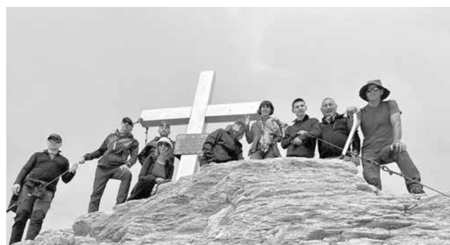
Преодоляха трасе с най-висока степен на трудност в Австрийските Алпи