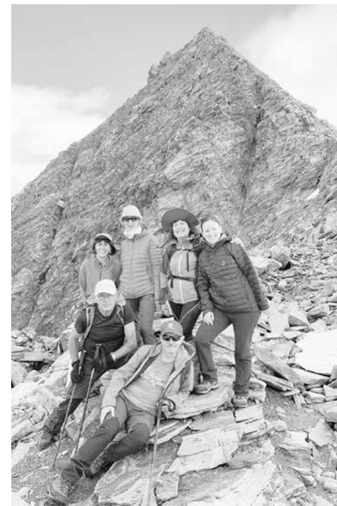
Формулата на успеха – взаимопомощ и подкрепа