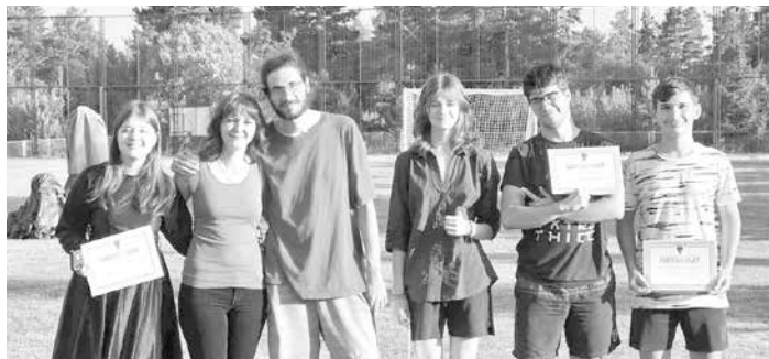
Галимира с участници в школата