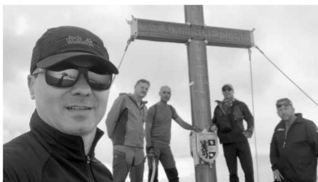
На един от трихилядниците