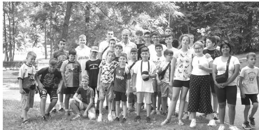
На старта на снимките за филма – учениците и кметът с обща снимка

детски площадки и зони за отпоч, монтират се указателни табели по екопътеките до природните забележителности. Общинската администрация има проекти за подобряване на пътищата, които водят до конкретни туристически обекти. Реновират се хижи и пътят до тях в курортната мест-