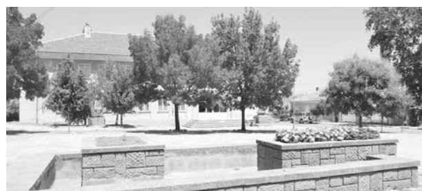
Село Пирне