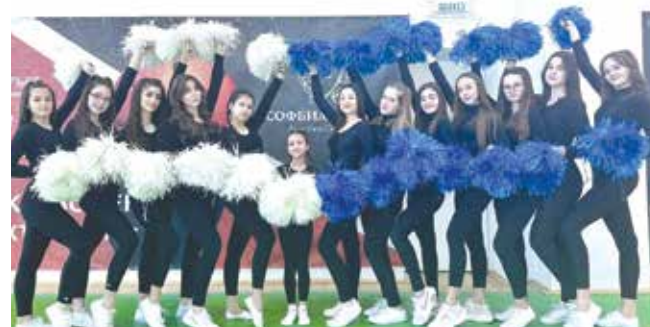
С мажоретния състав на СУ „Никола Вапцаров“