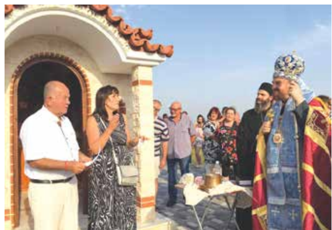
Ктиторите сем. Ерген