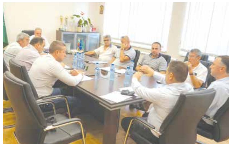
Коалиция ПП-ДБ нямаше претенции за ръководните длъжности в комисията