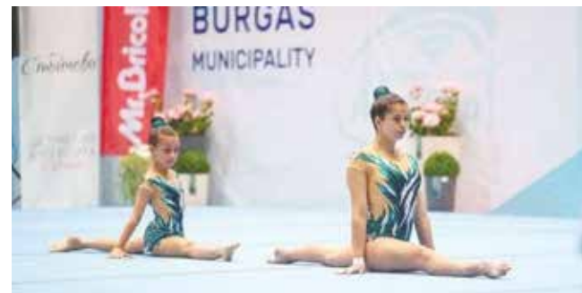
На квадрата, на поредното състезание по спортна акробатика