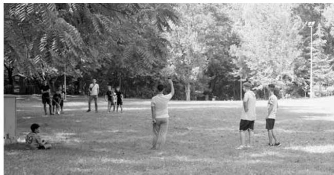
С желание пред камерата на БНТ застанаха айтоски ученици, които бяха дошли да спортуват на поляната