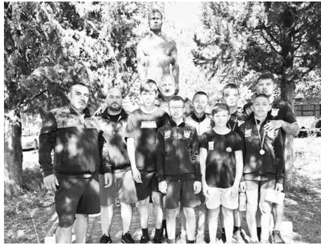
Пет медала за отбора на момчетата от турнира в памет на Никола Станчев