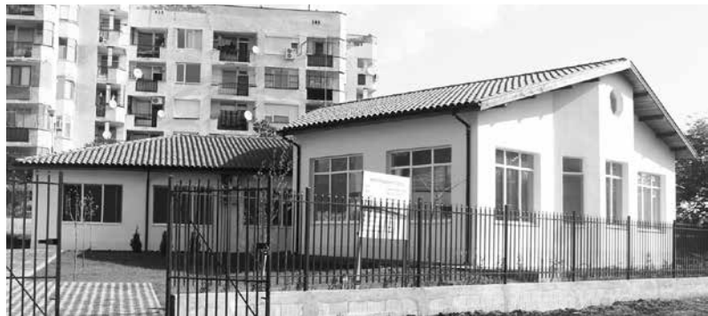
Защитено жилище - Айтос

Във връзка със сключен договор на 27.04.2023 г. за съвместна дейност между „Фонд социална закрила“ към МТСП и Община Айтос, с предмет закупуване на оборудване и/или обзавеждане по проект „Закупуване на оборудване и обзавеждане на помещението на Защитено жилище за лица с умствена изостаналост“,