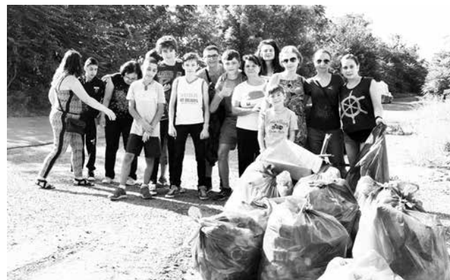
Учениците на ПГСС „Златна нива“ – най-активни в кампания 2019

Искаме да живеете на чисто?! Включете се!