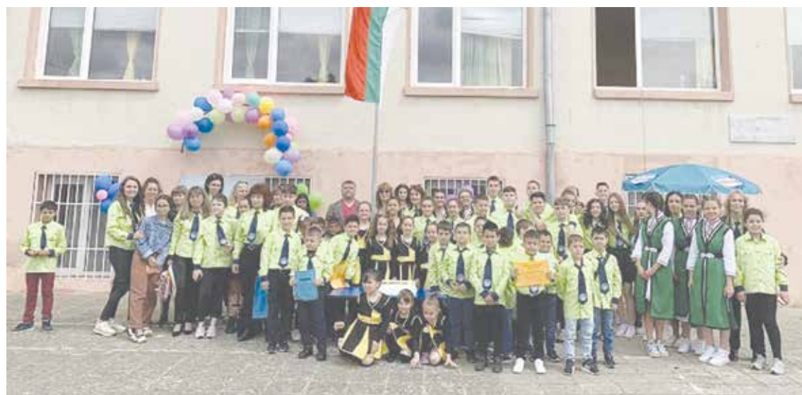
Децата на Карагеоргиево

Това не е първата благотворителна кампания, в която се включват младите на Карагеоргиево. Децата вече събираха пари за пострадали при наводнението в с. Каравелово, дариха и средства за семейства, пострадали при земетресението в Турция. НП