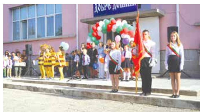
Учебната година СУ „Христо Ботев“, Айтос се открива на 15 септември в 9.30 ч.