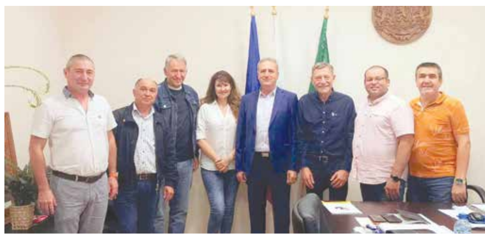
Кметът с гостите и част от членовете на борда на Ротари – Айтос