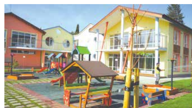
Официално откриват новата детска градина „Слънце“ на 18 септември от 10.00 часа