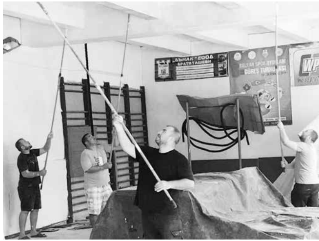
Родителите с грижа за борците

През септември, в продължение на няколко дни, мъжката родителска половина поела освежаването и ремонтирането на тренировъчната зала на борците. Всеки програмира времето си, и кога-