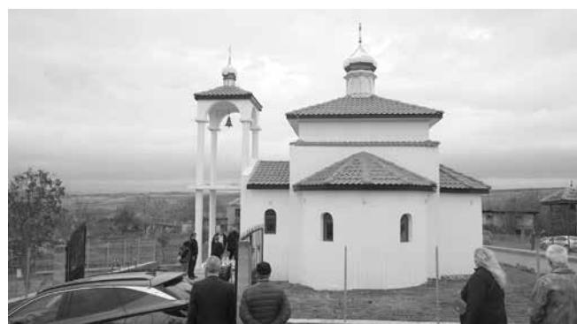
Храм „Св. Рождество Богородично“, с. Дряново