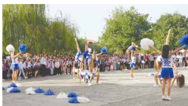
Първият звънец ще удари най-рано в СУ „Никола Вапцаров“, Айтос – в 8.30 часа