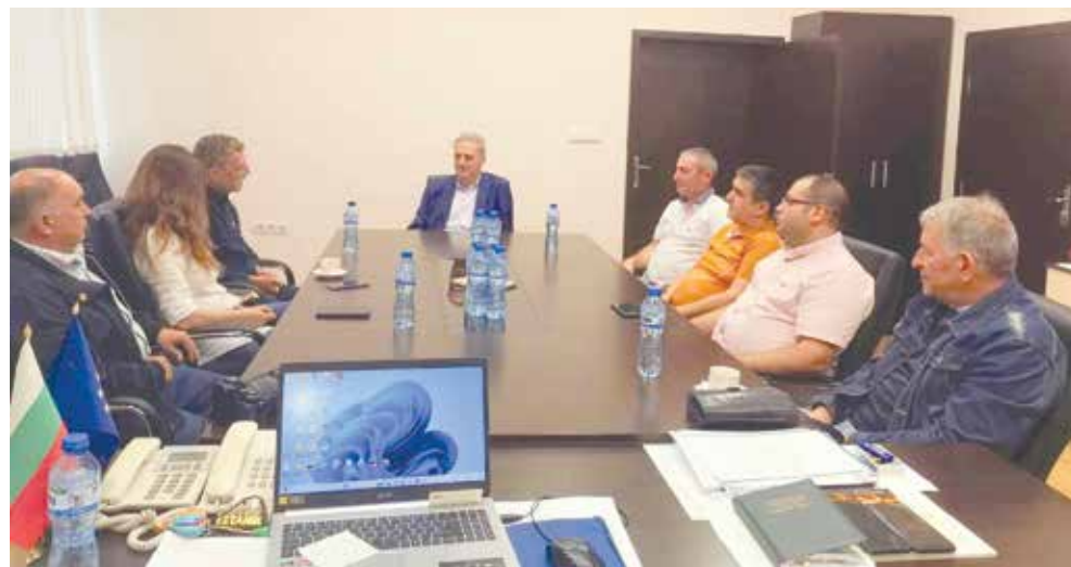
Разговор по темите, идеите и проектите на Ротари и местната власт

Програмата на Ротари – Айтос е приоритетно насочена към децата, младите хора и образованието. „Сътрудничим си с Общината за организирането и провеждането на вече традиционни инициативи, свързани със спорта, образованието, традициите и айтоските забележителности. След като изпълнихме проекти за благоустрояването на терена около извора на Славеева река и входния знак на града „Аетос с орела“,