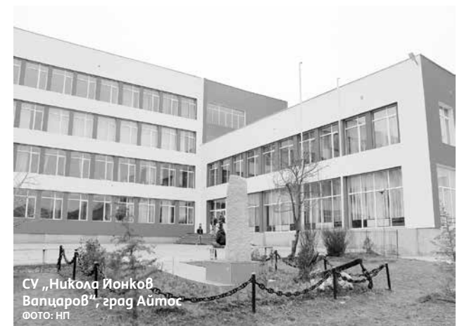
СУ „Никола Йонков Валцаров“, град Айтос