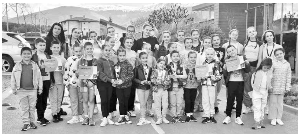
С медалите и купите след големия успех

Четири квоти за Световното първенство по танци Dance World Cup в Прага 2024 получи от строгите съдии айтоската танцова школа. И това не е първият успех на Школамата – още преди девет години „Тиара“ имаше първата си блестяща изява на световния дансинг.