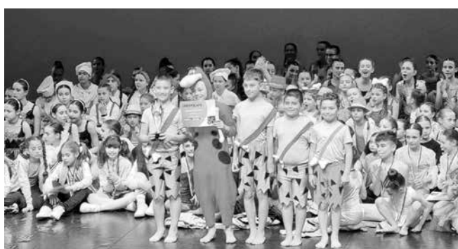
Журито и публиката впечатлени от талантиливите танцьори на айтоската школа