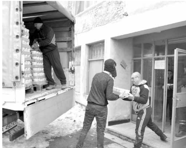
Пред пункта на ул. „Паркова“

Пакетите с храна са предназначени за лица и